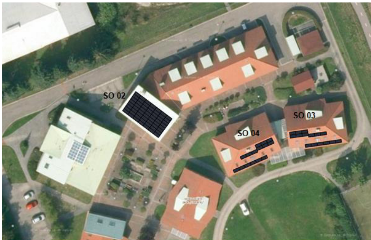
Obr. č. 3 Předpokládané rozmístění panelů na střechách