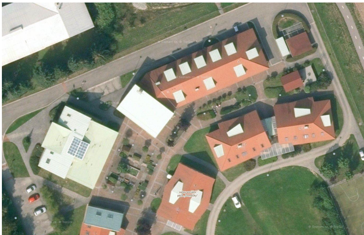
Obr. č. 2 Domečky Rychnov nad Kněžnou