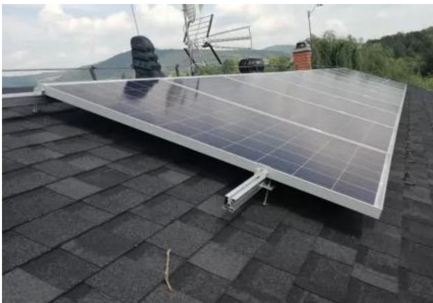
Obr. č. 5 Umístění panelů na roznášecí konstrukci

Pro instalaci fotovoltaických panelů na střeše je možné jako nejvhodnější řešení zvolit pevně kotvenou roznášecí konstrukci. Konstrukce je vyobrazena na následujících obrázcích.